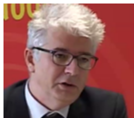
Pierre Lacueille , Délégué académique à la formation des personnels de l'Éducation nationale (DAFPEN) - France